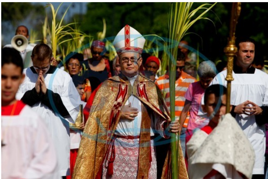
Jaime Ortega, bývalý arcibiskup Havany 20

Až v 90. letech začal režim zákazy náboženské aktivity zmírňovat a dnes už lidé mohou legálně vyznávat kterékoli náboženství. 60% populace se hlásí k Římskokatolické církvi a až 80%, tedy i mnoho křesťanů, praktikuje do jisté míry původní africkou Santérii. 19