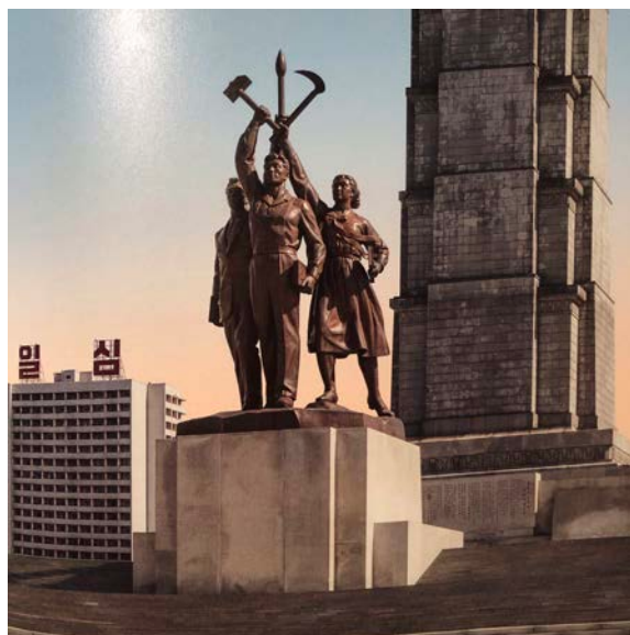
Věž Čučche, Pchjongjang 36