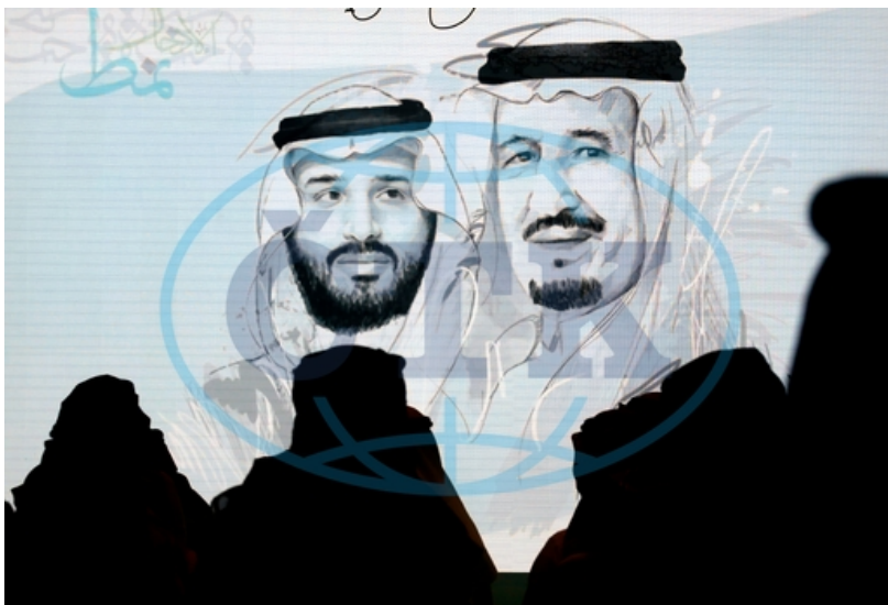
Král Salman a jeho syn Mohamed 6

Dnešní Saúdská Arábie je stále teokratická absolutní monarchie. Vládní systém je velmi podobný tomu z roku 1932. Většina vlády je tvořena přímo královskou rodinou a v čele vlády stojí král, v současné době Salman bin Abdulaziz Al Saud. 5