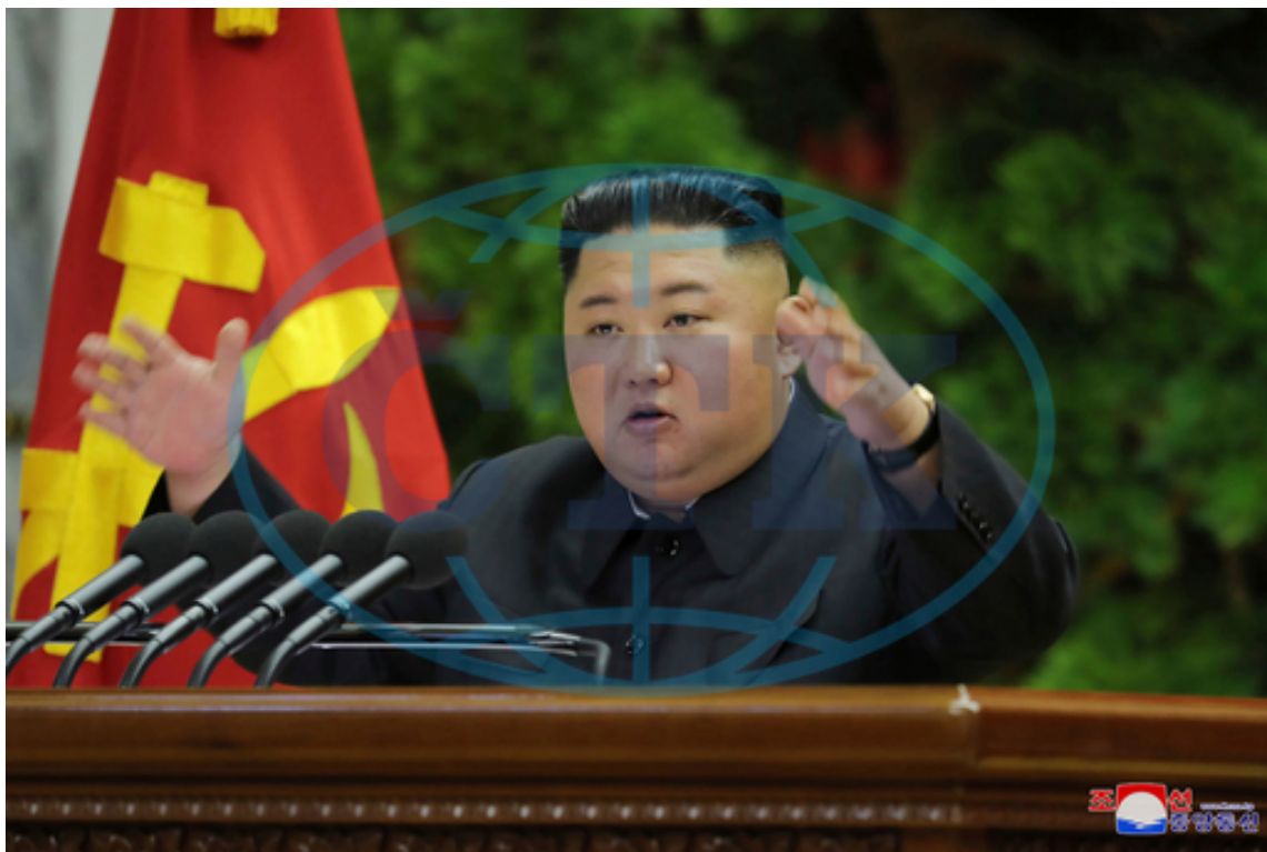
Současný lídr Kim Čong-un 31

Severní Korea (KILDR) je jedním z nejmilitarizovanějších míst planety s armádou čítající 1,3 miliónu vojáků a rozvinutým jaderným programem, i přestože v hospodářství výrazně zaostává za zbytkem světa. Vláda Kim Čong-una omezuje všechny občanské a politické svobody včetně svobody projevu, shromažďování, sdružování a náboženského vyznání. Zakazuje také veškerou organizovanou politickou opozici, nezávislá média, občanskou společnost a odbory.