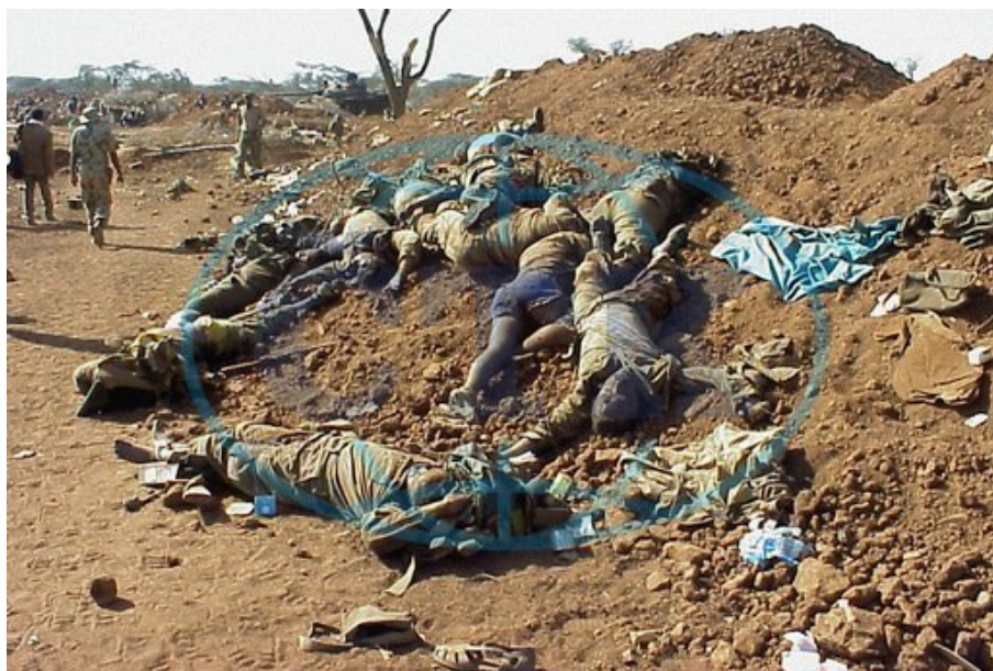
Oběti konfliktu Eritreji a Etiopie, 1999 30

Strana sebe sama označuje za levicovou a ve svém programu má zmenšení propasti mezi bohatými a chudými či mezi městy a vesnicemi. Podle prezidenta Isaiasa Afwerkiho se snaží vytvořit nový ekonomický systém, který by napravil škody způsobené válkou před třiceti lety, uspokojil potřeby většiny, zaručil spravedlivý ekonomický vývoj a modernizoval tradiční zemědělské způsoby. 29