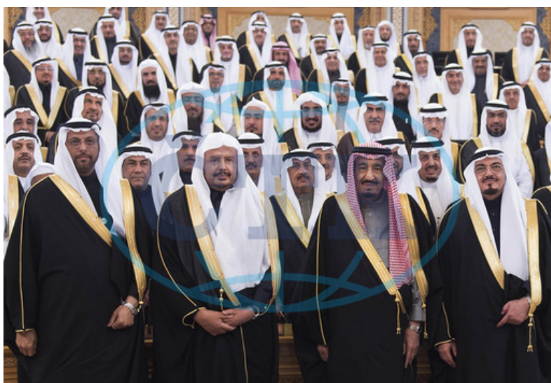
Král Salman s Poradním shromážděním 9

Výkonná moc je zcela v rukou krále. Ten má funkci předsedy vlády, kterou také sám jmenuje. Moc zákonodárná je částečně v rukou Poradního shromáždění (také jmenované králem), které však může zákony jen navrhnout, neboť musí být potvrzeny králem. 8