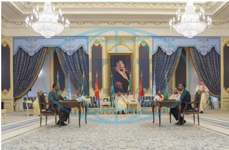
Setkání vůdců Eritreji a Etiopie v Saúdské Arábii 26

Konflikty Eritreu od jejího vzniku doprovázely téměř permanentně. Už dva roky po jejím vzniku začal spor s Jemenem o ostrov Háníš. 24 Od roku 1998 do roku 2000 probíhala válka s Etiopií a v roce 2008 došlo zase k územním sporům s Džibutskem. V letech 2010 a 2016 se pak Eritrea pokusila o zažehnutí dalšího konfliktu s Etiopií, což jen poukazuje na jejich napjaté vzájemné vztahy. 25